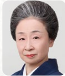
井上八千代 いのうえ やちよ