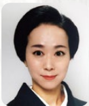
榎茂都梅昭野 うめもと うめあや